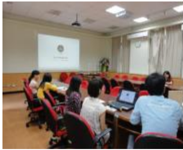
藝術家與藝文老師討論