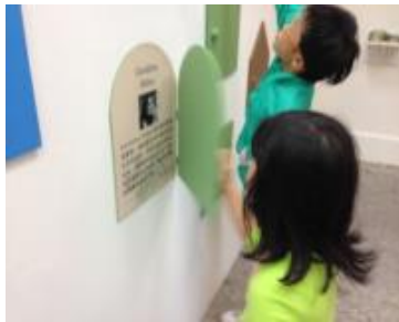
小朋友打開藝術家之窗