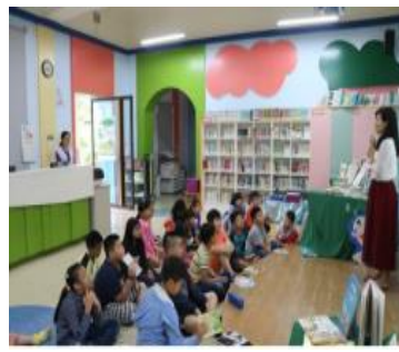
志工媽媽圖資利用教育