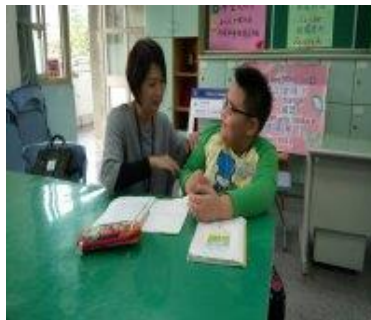
志工媽媽幫學生課業輔導