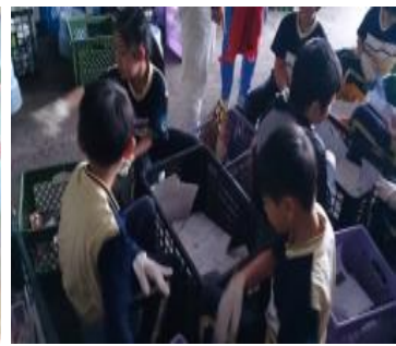
慈濟內湖環保站垃圾分類