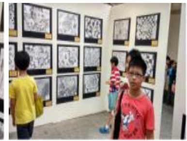
各班參觀畢業美展