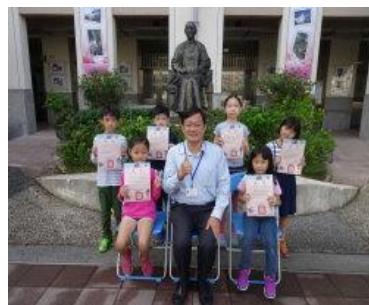
品德模範生與校長合影 2