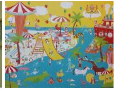
波隆納插畫展於本校展出