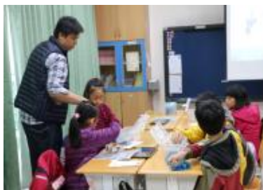
軍翰老師 Scratch 程式設計