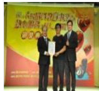
詹會長獲「捐資教育」獎