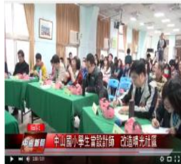
大同大學、晴光社區專家