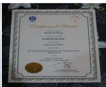
印尼青少年發明展解說