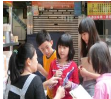
學生造訪社區採訪