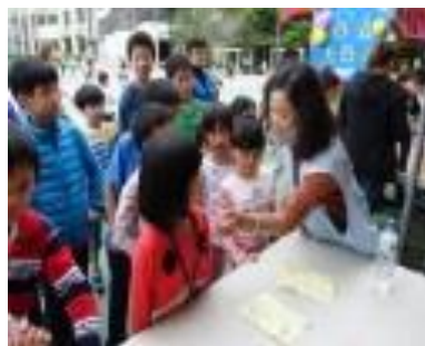
生命光輝活動志工媽媽核章