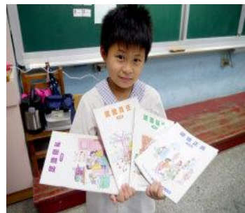
法治品德教育系列繪本