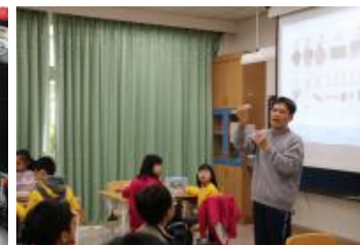
文正老師 Arduino 教學