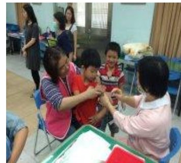
志工媽媽當健保義工