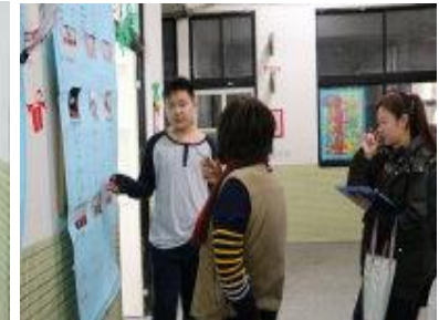
科展解說給評審聽