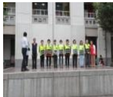
兒童朝會志工表揚