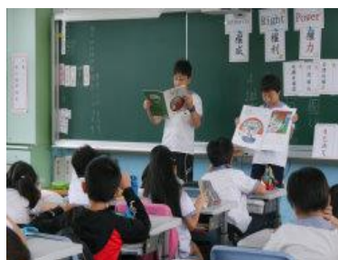
法治品德教育討論