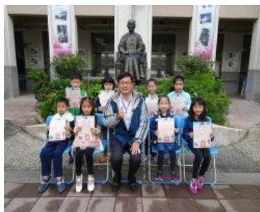
品德模範生與校長合影 1